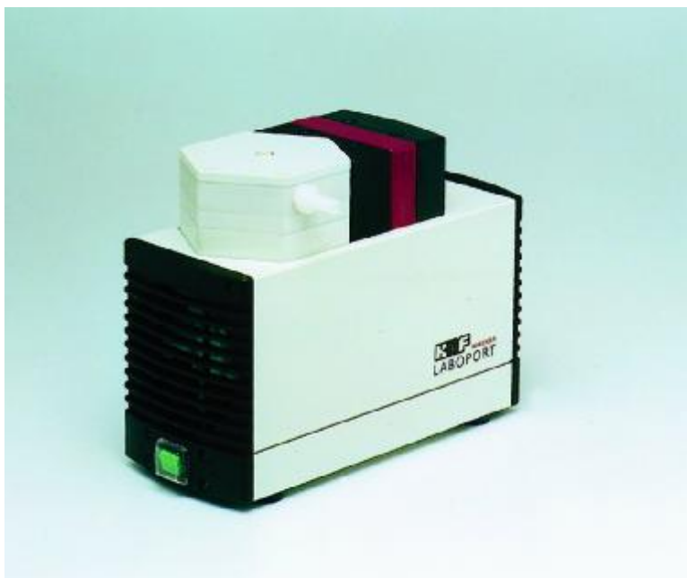
Pompa per vuoto N 840 FT.18