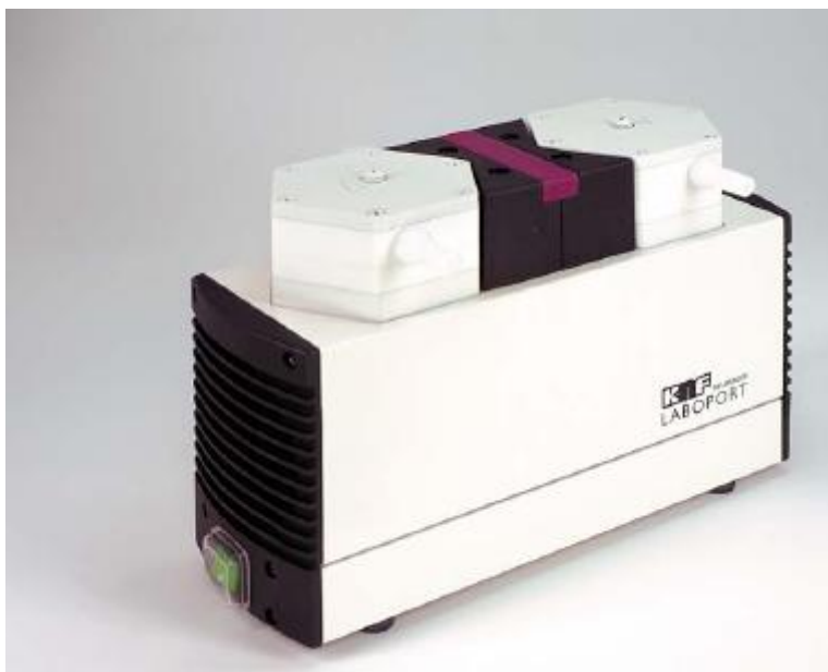
Pompa per vuoto N 820.3 FT.18