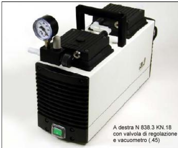
A destra N 838.3 KN.18 con valvola di regolazione e vacuometro (.45)