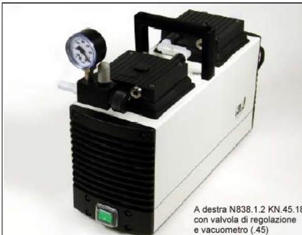
A destra N838.1.2 KN.45.18 con valvola di regolazione e vacuometro (.45)