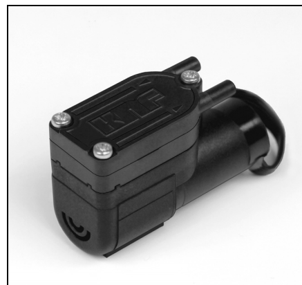
NMS 020 B