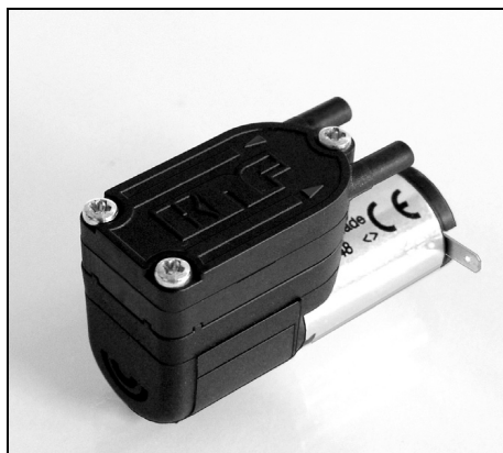
NMS 020 L